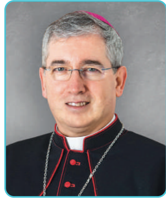
† Fernando Prado Ayuso Obispo de San Sebastián

Un año más, el Día de la Iglesia Diocesana llama a nuestras puertas. Una jornada que nos recuerda que somos Iglesia con los demás, que pertenecemos a una Iglesia universal que se hace más concreta y visible en nuestra Iglesia local de Gipuzkoa. La Iglesia diocesana de San Sebastián es el lugar en el que vivimos, celebramos y fortalecemos juntos nuestra fe y nuestra propia vocación. Cada uno lo hacemos desde lo que somos: sacerdotes, personas consagradas, laicado. ¡Qué importante es sentirnos llamados! El Señor nos ha dado a todos y a cada uno una vocación propia y particular. No dejemos de orar para que todos encontremos nuestro lugar en el mundo y en la Iglesia. No dejemos de orar por las vocaciones.