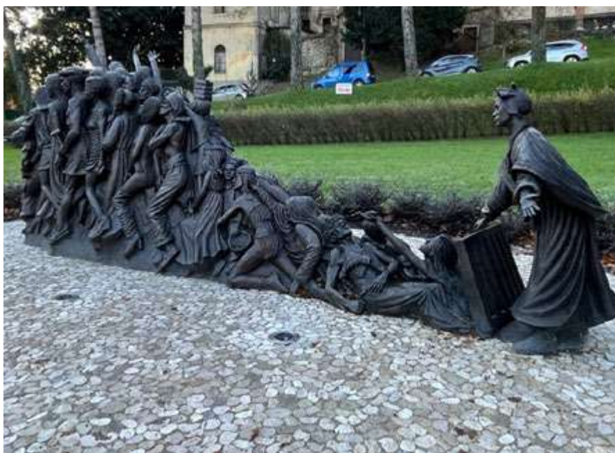
Escultura Timothy Schmalz “Let the oppressed go free”.

Esas figuras representan a millones de personas reales, con nombre, con historia, con sentimientos, a los que la dureza de su existencia, no les permite soñar, ni siquiera desear, o aún diría más, no les permite vivir, apenas sobrevivir. Podríamos ser tú y yo, si hubiésemos nacido en otro país, en otra familia, en otras circunstancias. ¿Qué nos diferencia? Que nuestras esclavitudes son más sutiles, más sibilinas, pero qui-