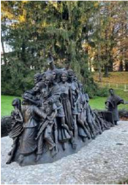
Escultura Timothy Schmalz "Let the oppressed go free".